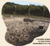
CISTERNA ROMANA DI SPOLETINO RIEMPIMENTO DI I SEC. d.C.